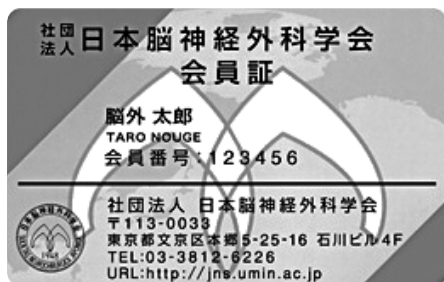
（一社）日本脳神経外科学会 会員証

学会参加期間中は、毎日、来場時（学会場にきた時）および退場時（学会場から帰る時）に領域講習受付を「下記」会員証（IC カード）で行ってください。